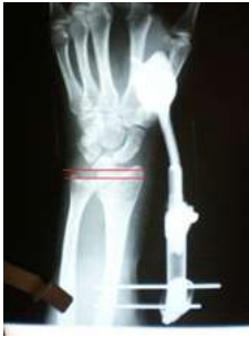
Fig. 1. Excesiva distracción favorece la distrofia simpática refleja.