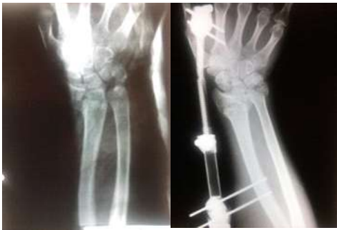
Fig. 2. Fractura expuesta gusli 1 Masc. 43años

La utilización de injerto óseo en FEDR en pacientes con bajo stock del mismo o en fracturas colapsadas no han demostrado una mayor estabilidad ni diferencias en los resultados en fracturas inestables (13,14). Por otro lado, la colocación del injerto requiere de la apertura del foco fracturario dañado el hematoma fracturario, cuando la fijación externa promueve una reducción cerrada y una consolidación más biológica.