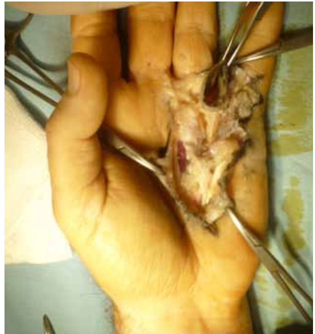
Figura 4. El colgajo comisural palmar levantado a distal permite una amplia exposición de la región metacarpofalángica de rayos contiguos.

El diseño de las incisiones es probablemente el detalle técnico más importante para el correcto tratamiento quirúrgico de la ED. Se han propuesto varias alternativas: incisiones en zigzag, 4 longitudinales más zetaplastias, 5,6