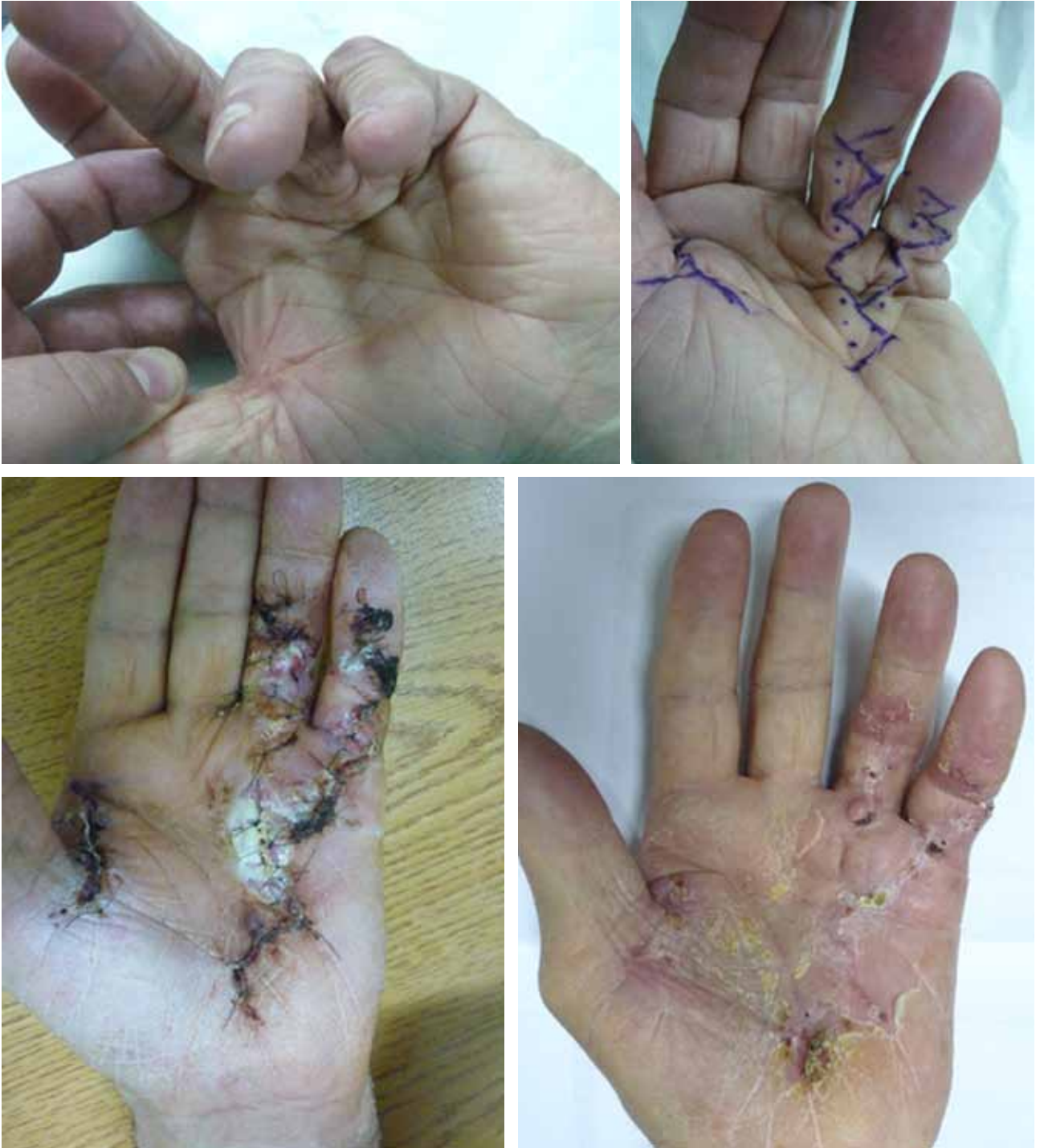
Figura 2. Secuencia evolutiva de caso con afección del 4.º y 5.º rayos. Diseño de colgajo en la 4.ª comisura. Necrosis distal parcial y buena evolución con cierre de técnica de palma abierta.

La prolongación proximal se puede continuar según técnica en zigzag, en V-Y o en forma transversal. A nivel distal, el abordaje de cada dedo se realiza según la técnica de Bruner o la preferencia del cirujano.