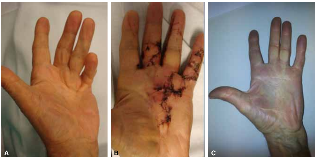
Figura 1. Secuencia de caso con afección del 3.º, 4.º y 5.º dedos. A. Imagen preoperatoria. B. A los 15 días de la cirugía. C. A los 4 años de seguimiento.

Se practica el tallado de un colgajo romboidal de base distal cuyo vértice proximal no se prolonga más allá del pliegue palmar distal. Su eje longitudinal se centra en la correspondiente comisura y es conveniente que sus vértices transversales no sobrepasen el eje longitudinal de cada uno de los dedos, para estar dentro de una zona segura (Fig. 3).